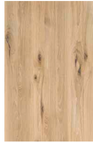
Eiche Wild Weißöl*