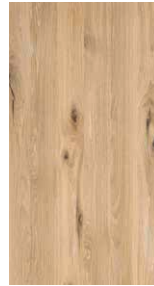
Eiche Wild Weißöl*